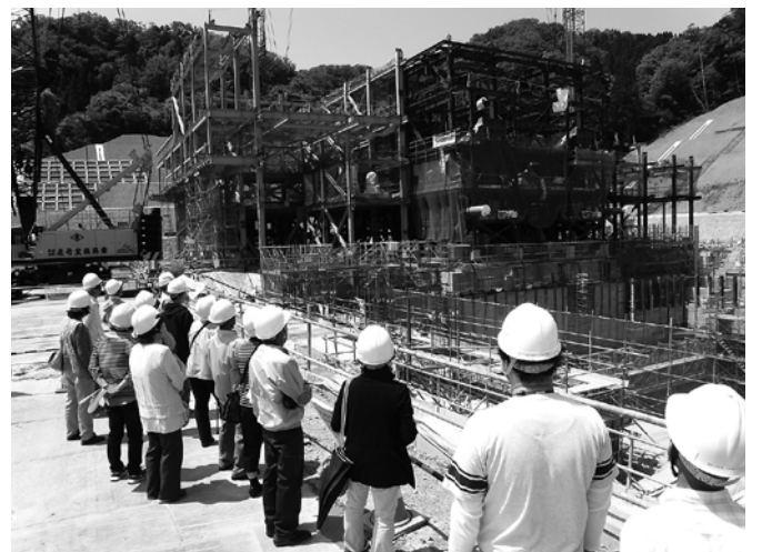
▲第1回現場見学会の様子