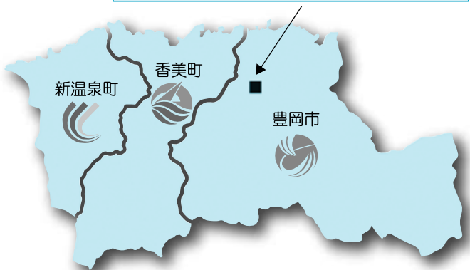
【新施設建設地】豊岡市竹野町森本・坊岡地内