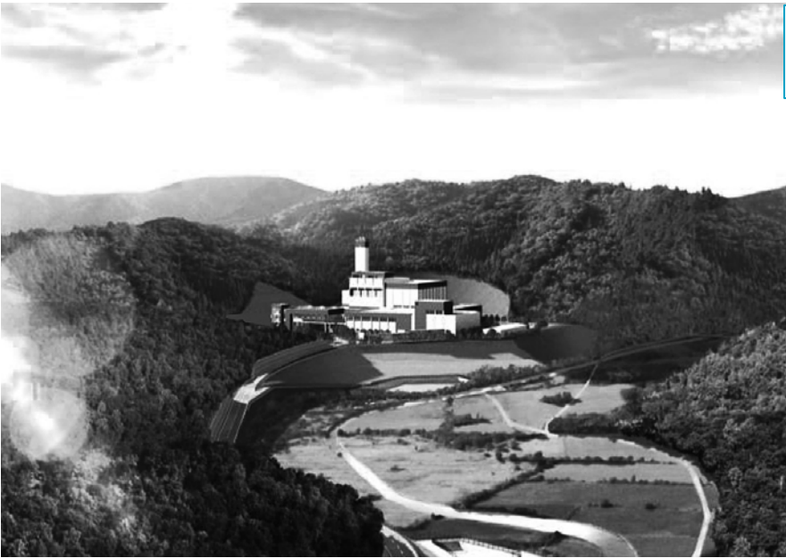
▲新施設遠景のイメージ図