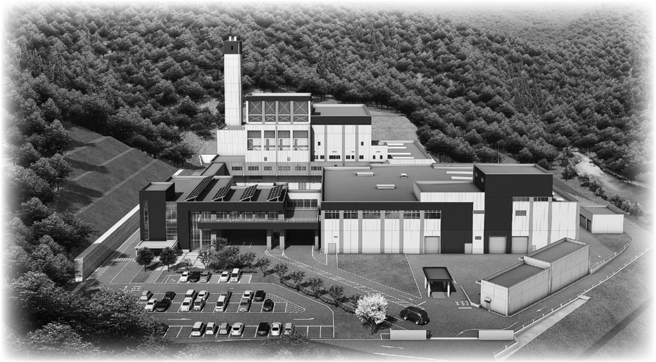
構成市町の概要(平成27年5月1日現在)