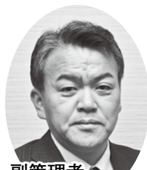
副管理者 浜上 勇人 (香美町長)