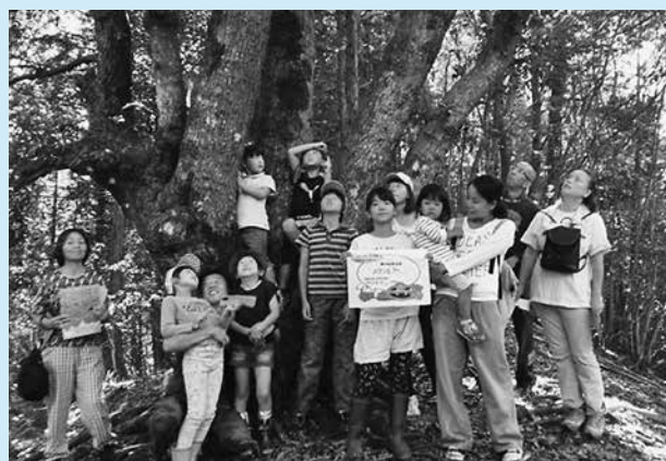
▲樹齢300年(推定)もある大きな木の前で記念撮影