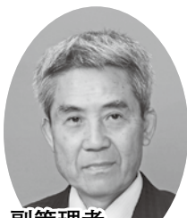
副管理者 西村 銀三 (新温泉町長)