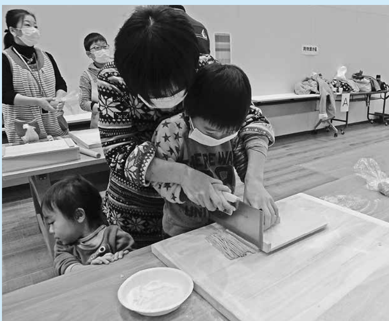
▲お母さんに手伝ってもらってのソバ切り上手に切れるかな