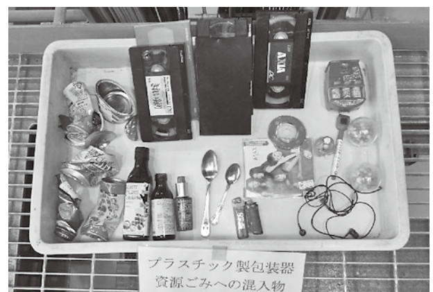
プラスチック製包装器 資源ごみへの混入物 ▲プラスチック製容器包装の資源ごみ袋に混入していた異物

ごみは分別することによって資源となりますので、分別の徹底にご協力をお願いします！