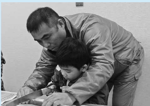
▲お父さんと力を合わせて切っています