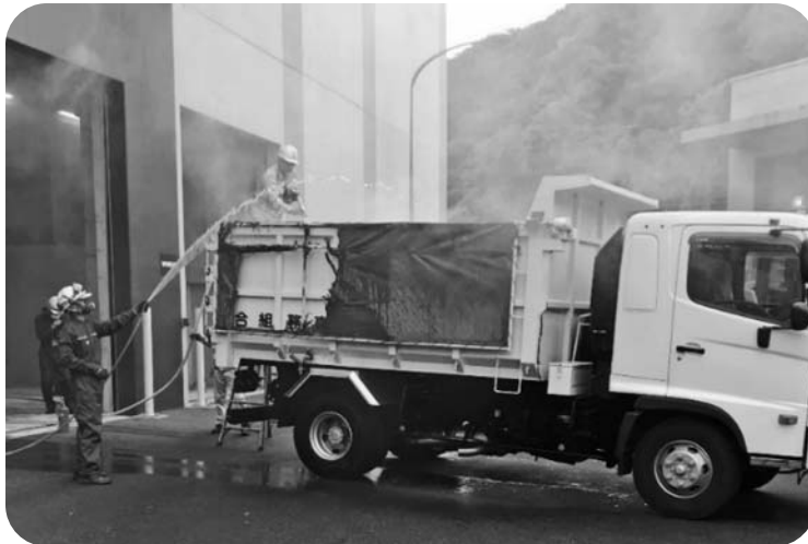
▲ 消火作業に当たる職員