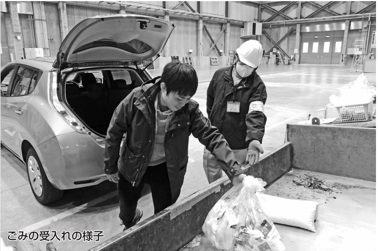
ごみの受入れの様子