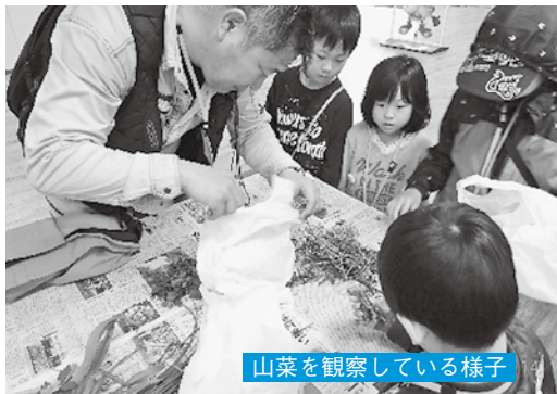
山菜を観察している様子