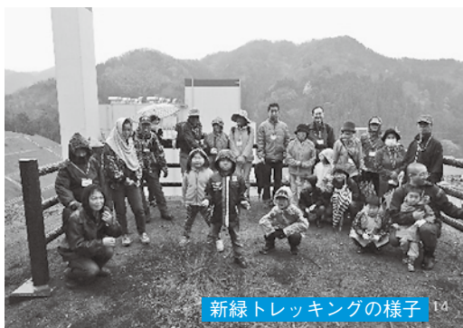
新緑トレッキングの様子