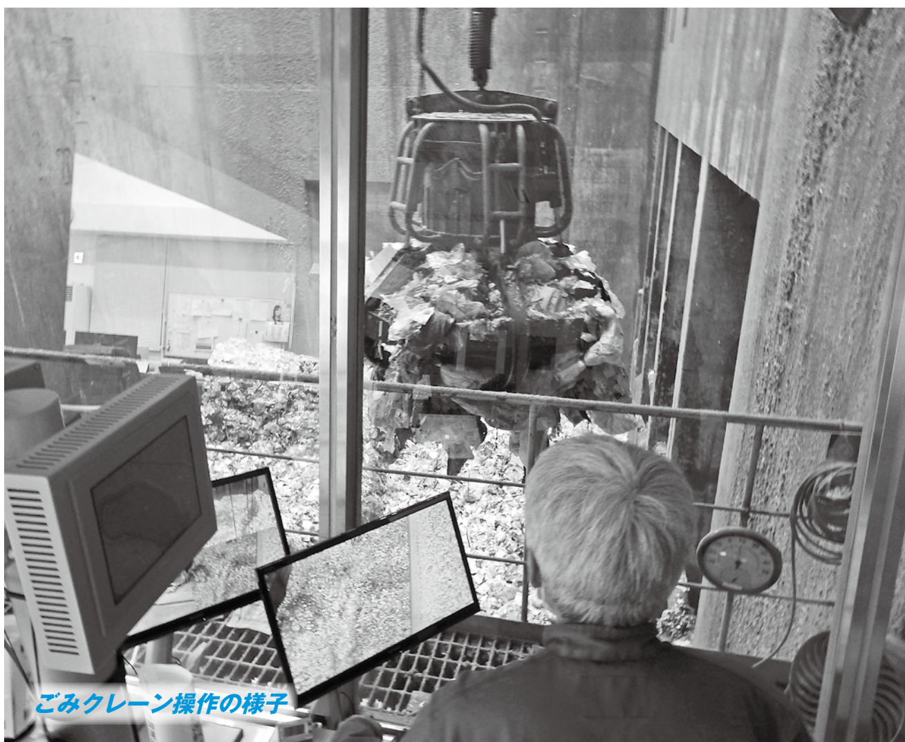
ごみクレーン操作の様子

ごみを焼却炉へ運ぶクレーン操作の様子です。クリーンパーク北但へ持ち込まれたごみはクレーンを使って焼却炉へ運ばれます。ごみクレーンは貯留されたごみを混ぜる作業にも活躍します。ごみを貯留するごみピットに不適物が入ってしまうと取り出すことは困難です。適切な分別にご協力をお願いします。