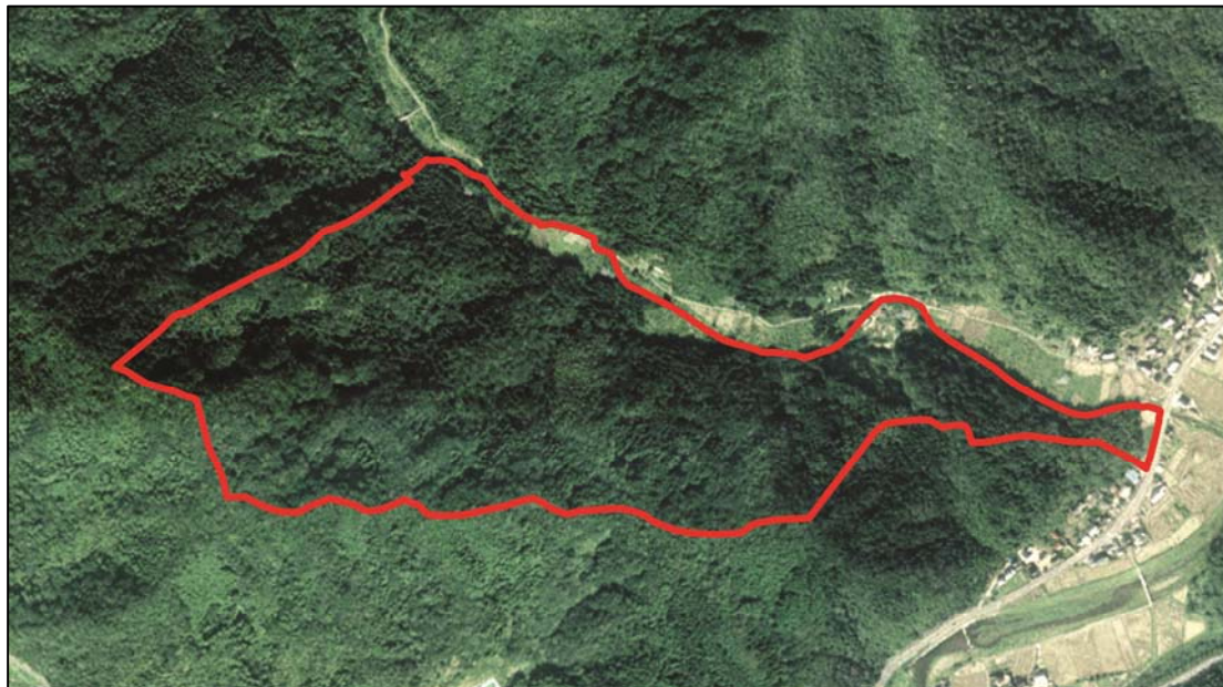
事業用地（上空より撮影）

施設整備検討委員会として、(仮称)北但クリーンセンター設置に係る生活環境影響調査の結果について内容を確認し、生活環境の保全上の見地からの意見並びに事業者の見解の報告を受け、本調査の総合評価である「総合的に見ても生活環境の保全に支障のないものと評価しました。」との記述は妥当なものであることを確認し、管理者に報告した。