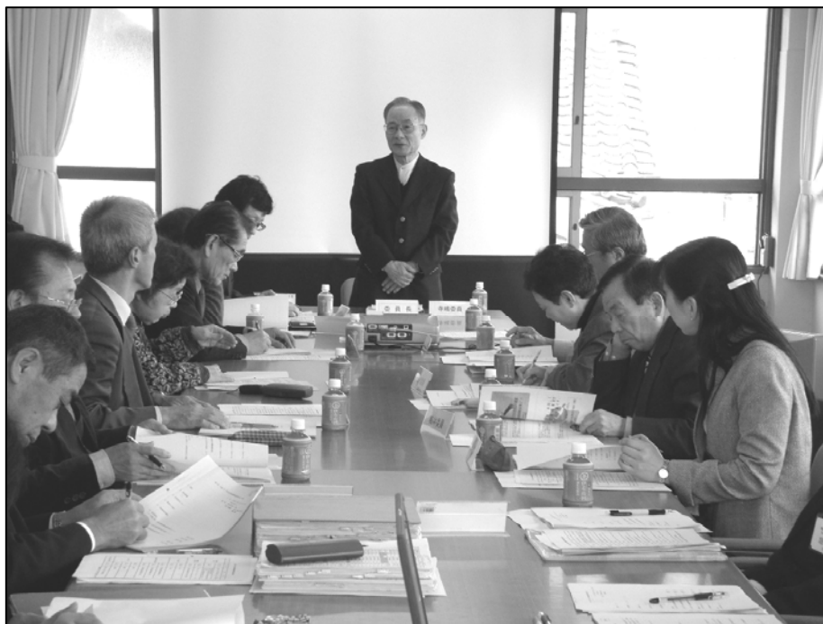
第1回施設整備検討委員会